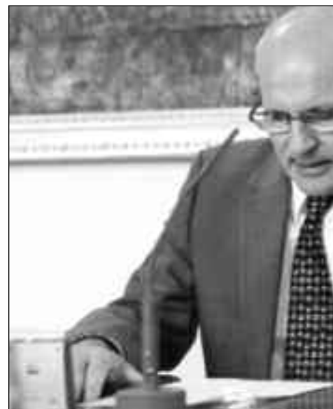
František Mikloško, Hauptorganisator des Sturzes des kommunistischen Regimes

In den ersten 20 Jahren nach dem Umsturz im November 1989 waren in der Slowakei Menschen in verschiedenen Positionen im Kampf um Werte an der Macht, die ihre besten Jahre im Kommunismus verbracht hatten. Heute trifft man in den unterschiedlichsten Positionen Menschen, die sich nach der Wende vor allem