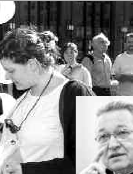
Kardinal André Vingt-Trois