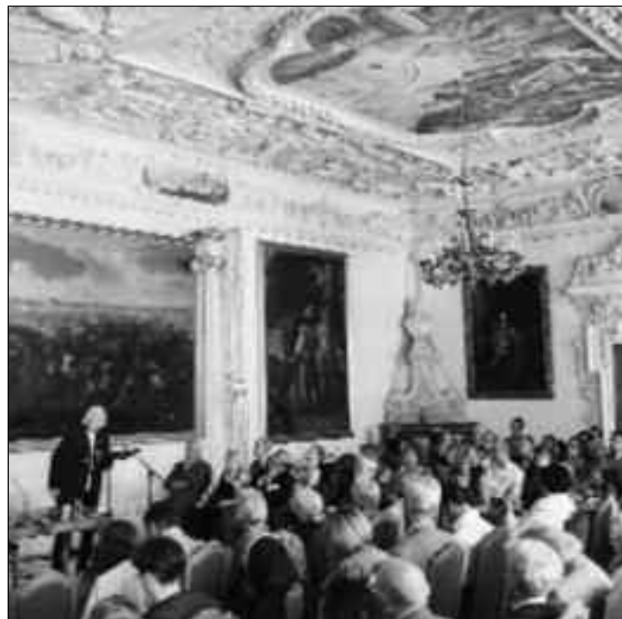
Aufmerksame Zuhörer eines mitreißenden Vortrags

Auch schon im Säuglingsalter prägt sich ebenso stringent wie