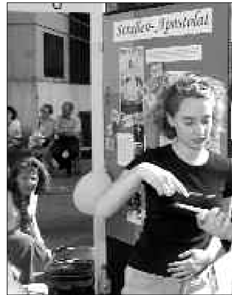
Apostolat: Überzeugend, wenn die Missionare Freude ausstrahlen

Bisher haben wir zwei Punkte betrachtet: Sich den Reichtum, den wir besitzen bewusst zu ma-