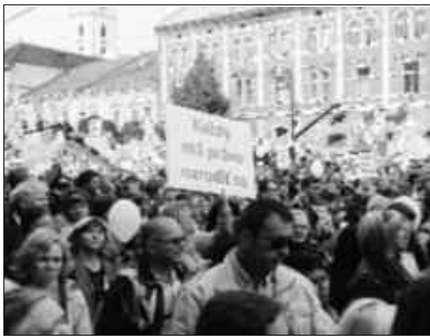
Kosice : 80.000 Teilnehmer beim Marsch für das Leben