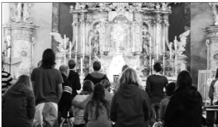
Pöllau: Anbetung in der Kirche und Spaß mit Gleichaltrigen