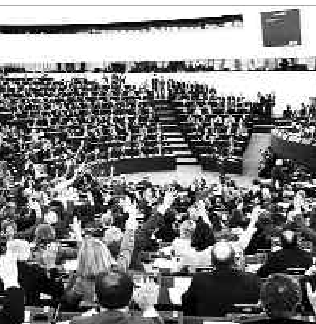
ament: Zwei-Drittel-Mehrheit für Lunacek-Bericht

Noch eine letzte Meldung: Ein UN-Komitee zur Überwachung der Kinderrechte verurteilte in einem Report vom 31. Jänner die Sexualmoral der Katholischen Kirche. Die Lehre müsse sich in Sachen Ehe und Sexualität ändern, denn sie halte Heranwachsende davon ab, Verhütung in Anspruch zu nehmen, hieß es.