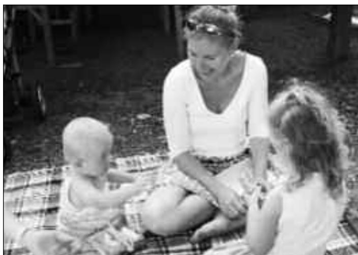
Es bleibt dabei: Das Zentrum der Familie ist die Frau

Die Väter wiederum sind – auch mehr denn je – aufgerufen, die Familien durch unterschiedenes Auftreten in Gesellschaft, Politik und Medien vor den zerstörenden Einflüssen von außen zu schützen und sich treu zu ihrer Familie zu bekennen. Tun wir das alles nicht, so wird die verblendende Indoktrination von außen, die den Müttern erklärt, ihr Kind bedrohe ihre Freiheit und Selbstverwirklichung (ist es nicht umgekehrt?!), man müsse sich schnellstens, so gut es geht, da-