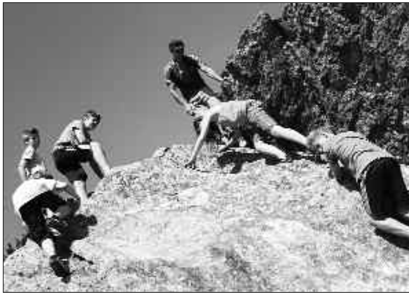
Familien brauchen Halt, Griffe zum Festhalten, wie beim Bergsteigen...

Möglichkeit, dies zu erfahren. Die im Folgenden beschriebenen „Griffe“ sind Schlüsselerfahrungen, die sich in den letzten 12 Jahren Jungfamilientreffen verdichtet und bewährt haben. Es sind die „wichtigen Griffe“ die helfen, das Ziel zu erreichen.