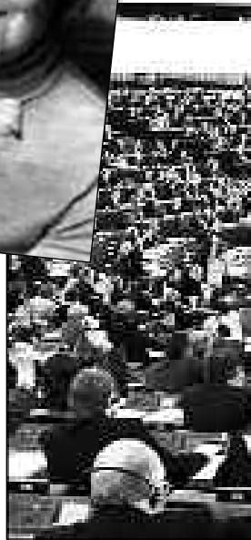
Abstimmung im EU-Parlament