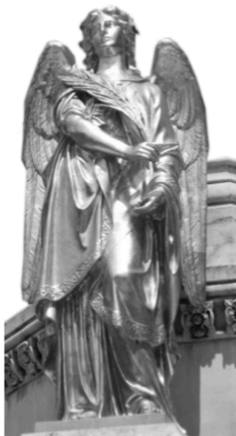
Eine besondere Aufgabe des Schutzengels: Im geistigen Kampf gegen Versuchung beizustehen

Mittlerweile bin ich seit acht Jahren Lehrerin, in dieser Zeit jedoch langsam, aber sicher in den Bereich des Religionsunterrichts gerutscht und die Idee „Religionspädagogik“ zu studieren wurde geboren. Aber, wo? Zufällig (ein Augenzwinkern Gottes) hör-