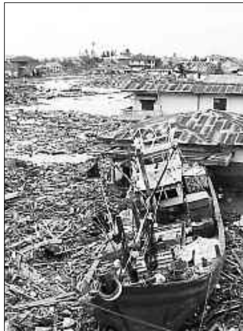
Tsunami 2004: Die Gefahr großer Naturkatastrophen nimmt zu

männlich, zwischen 20 und 30 Jahre alt, unverheiratet und Student mit linksliberaler Einstellung. „Vielschreiber“ verfassten mitunter mehr als 20.000 Bearbeitungen pro Jahr. Nach Einschätzung Hohages ist das kaum möglich, wenn man außerdem noch einer geregelten Tätigkeit bzw. einem Studium nachgeht. Hohage äußerte deshalb die Vermutung, dass einige Vielschreiber von Parteien oder weltanschaulichen Gruppierungen für ihre Arbeit Geld bekämen. (...) Manipulationen würden zwar meist irgendwann aufgedeckt, jedoch reagiere Wikipedia aufgrund ihrer meritokratischen Struktur mitunter ausgesprochen