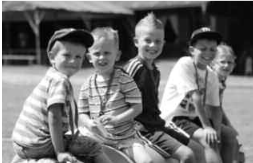
Der Kontakt mit gleichgesinnten Gleichaltrigen ist für Kinder entscheidend

wahr wird, sich wahrhaftig miteinander konfrontiert und so immer mehr in die Tiefe wächst. Man entdeckt den anderen dann viel mehr mit allem Reichtum,