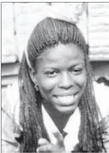
Erfolgreiche Einstellungsänderung bei der Jugend in Uganda

Auszug aus „Youth Alive – Eine junge Generation macht den Unterschied!“ in Schweizer HLI-Report 1/14.