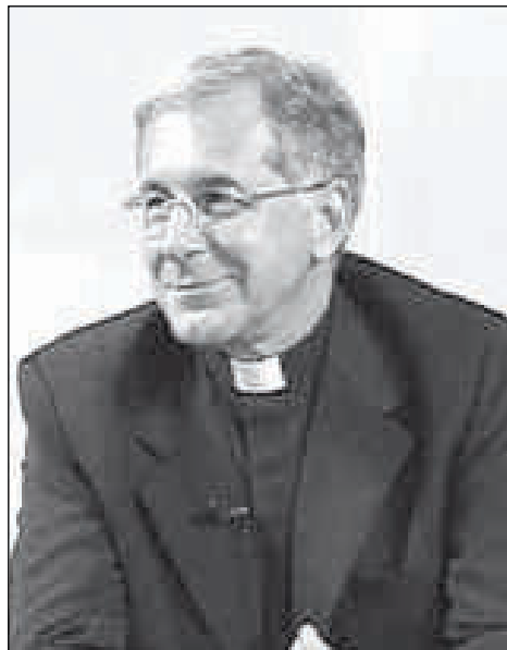
Erzbischof Renato Boccardo