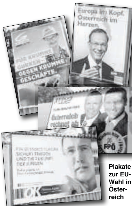
Plakate zur EU-Wahl in Österreich