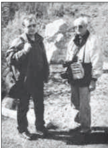
Besuch an der Gulag-Gedächtnisstätte

Jahre Strafe stehen. Und so engagiert er sich weiter bei der Pflege von Patienten, ist ein aufmerksamer Zuhörer, wenn die Leute von ihrem Schicksal erzählen. Er arbeitet auf der Gynäkologie, aber auch auf der Internen, wo die Obduktion von Mordopfern zu seinen Pflichten gehört. Mehrmals muss er sogar außerhalb des Spitals „ärztlich wirken“: etwa bei Vergiftungen durch Wetttrinken mit Spiritus (das gängige Getränk, 95% Alkohol) oder beim