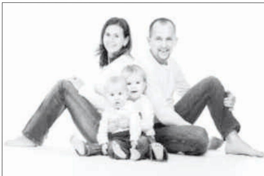
Familie: Für einen Großteil der Bevölkerung nach wie vor sehr wichtig

Die hier beschriebene und wahrlich besorgniserregende Lage ist für die herrschenden Kreise noch nicht schlimm genug. UNO, EU und unsere eigene staatliche Gesetzgebung fördern die Gender-Ideologie, deren Ziel die gänzliche Beseitigung der herkömmlichen