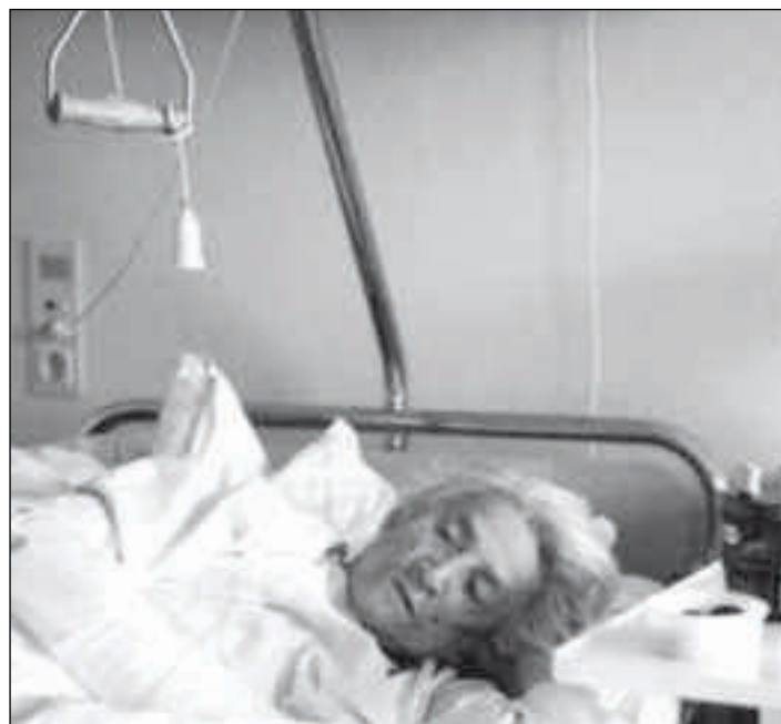
Sie betrachtete sich als sehr glückliche Kranke, weil ihre Familie geheilt worden war

Dankbarkeit das beste Heilmittel, wenn wir diese Untugenden, unter denen wir oft leiden, in uns erfahren. Ja, man kann wirklich sagen: Die Dankbarkeit ist ein Schlüssel zum Glück. Deshalb ermutigt der heilige Paulus die Thessalonicher: „Dankt für alles; denn das will Gott von euch, die ihr Christus Jesus gehört.“ (1 Thess 5,18)