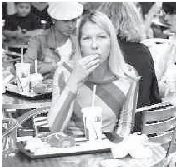
Fast-Food und Selfservice, Leben in der Anonymität...

Gesagten wird dem Menschen seit der Aufklärung suggeriert, er sei autonom, also selbstbestimmt, gewissermaßen seines Glückes Schmied. Die Welt des Sports, der Wirtschaft, der Hochschulen vermittelt den Eindruck: Du schaffst es, Du musst den Erfolg nur wollen, Dich anstrengen –