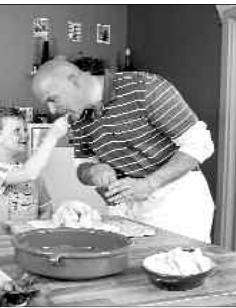
setzung für die Entfaltung der Kind

uns, weil sie unser aller tiefe Sehnsucht ansprechen: Von einem Menschen ganz angenommen zu sein – „in guten wie in bösen Tagen“ eben, „bis der Tod uns scheidet“.