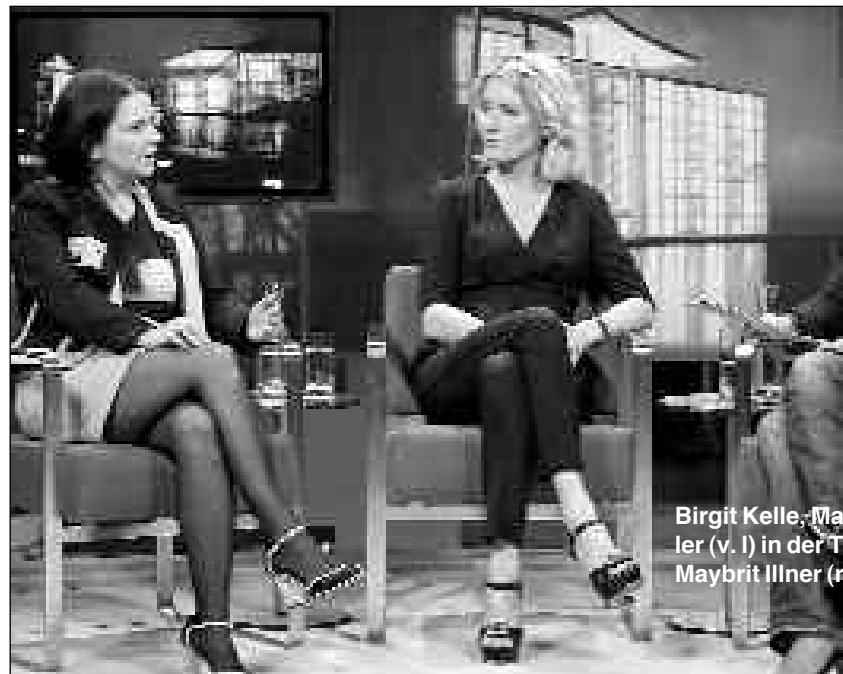
Birgit Kelle, Ma- ler (v. l.) in der T Maybrit Illner (r.)