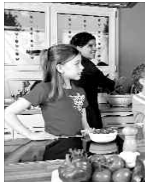
Geborgenheit in der Familie: wichtige Voraussetzung

man eine Familie braucht, um wirklich glücklich leben zu können.“ Und: „Wieder zugenommen hat der Wunsch nach eigenen Kindern. 69 % der Jugendlichen wünschen sich Nachwuchs...“ Das bestätigt, was die Österreichische Jugend-Wertestudie 1990/2000 ergeben hatte. Damals lag Familie mit 69% an zweiter Stelle (hinter „Freunden“), wenn die 16- bis 24-Jährigen danach gefragt wurden, welches für sie die wichtigsten Lebensbereiche seien. Bei dieser Gelegenheit konnten sie auch äußern, welche Haltungen ihrer Ansicht nach entscheidend für das Gelingen einer Ehe seien. Platz 1: die Treue (84%), deutlich vor Sex (61%).