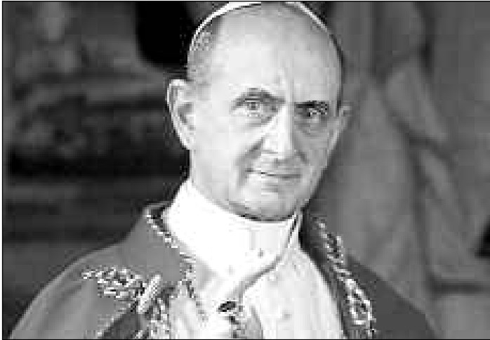
Papst Paul VI.: Nach der Veröffentlichung von Humanae vitae schlug die ursprüngliche Zustimmung in Ablehnung um

loyalität und den Ungehorsam vieler Priester, mancher Bischöfe und Kardinäle zu den folgenschwersten Ärgernissen in der Kirche – bis heute!