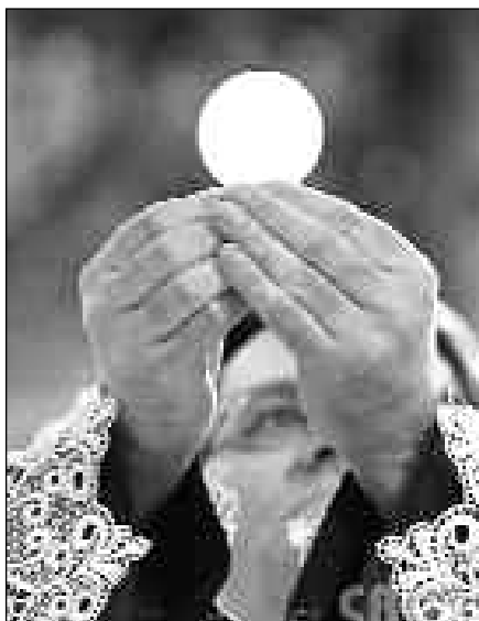
Wer die Eucharistie nicht empfangen darf, kann aus der Gnade der Taufe und Firmung Kraft schöpfen

der Beichte... Es gibt viele Umstände, in denen man Gnade ohne äußere Zeichen empfängt. Wer also zurecht glaubt, in einer regulären Ehe zu leben, aber nicht