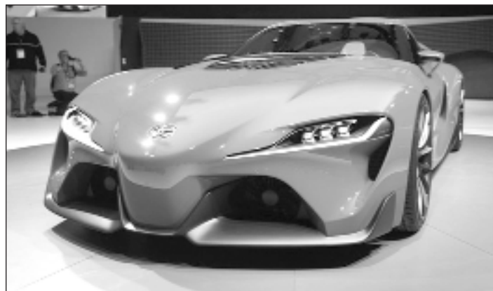
Je mehr Elektronik, umso besser überwachbar

Ein Beispiel für die Zweischnidigkeit des Eindringens der Elektronik in alle Lebensbereiche. Und gleich noch ein weiteres: