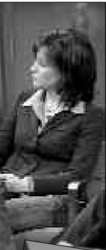
ria Furtwäng- alk-Show bei