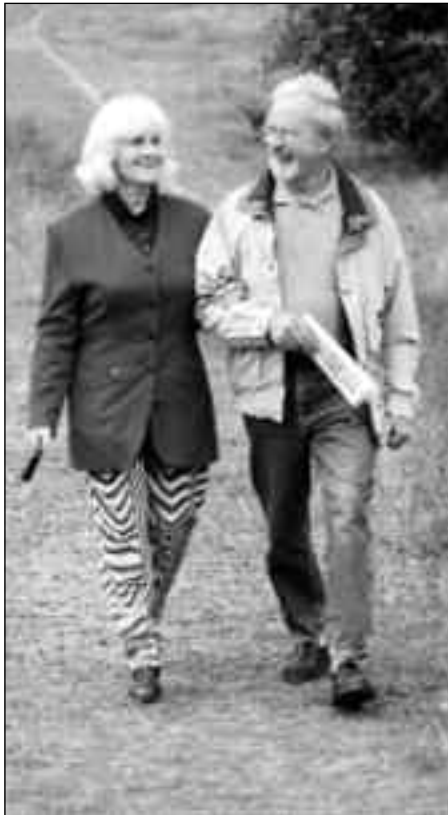
Lebenslange Treue: ein großes Kapital

man sich selbst als Sohn oder Tochter wahrnimmt, schätzt man das Ur-Geschenk des Lebens. Indem man mit Dankbarkeit auf das Geschenk des Lebens antwortet, das man umsonst empfangen hat, wird man sich des Rufes bewusst, dieses Geschenk in Liebe weiterzugeben: Ehemann und Ehefrau zu werden, die gemeinsam gerufen sind, Vater und Mutter zu werden.