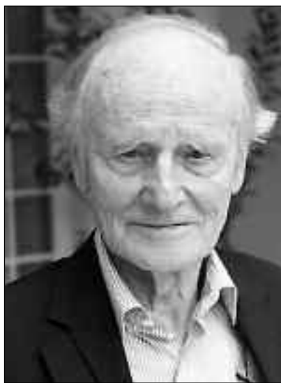
Professor em. Robert Spaemann

von Zeit und die Gewöhnung – so als hätten allgemeine gesellschaftliche Akzeptanz und unsere persönliche Zufriedenheit mit den eigenen Entscheidungen und dem eigenen Leben eine beinahe