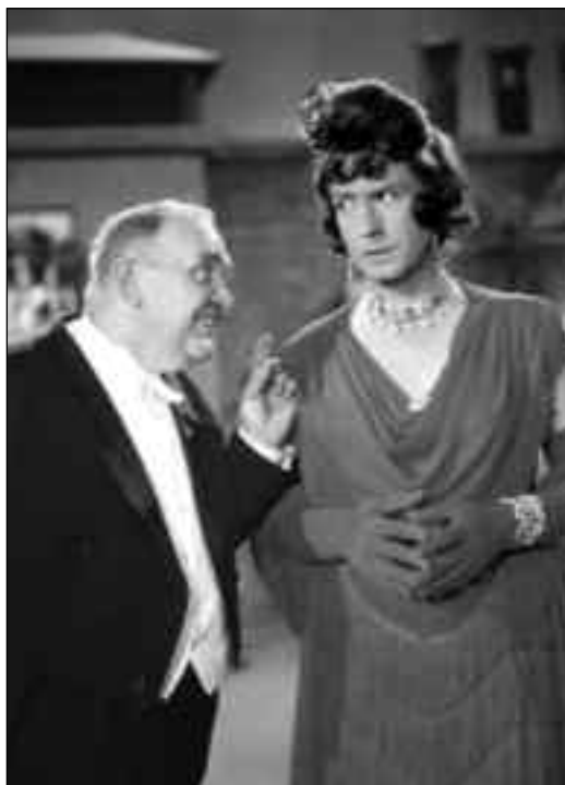
Peter Alexander in „Charleys Tante“ in Frauenkleidern: Was einst lustig war, wird heute ideologisch instrumentalisiert

Wir sprechen dabei nicht von einer künftigen Gefahr, einer Hypothese, sondern von einer Realität, die in den letzten Jahren, vorangetrieben durch eine massive und überaus aggressive ideologische