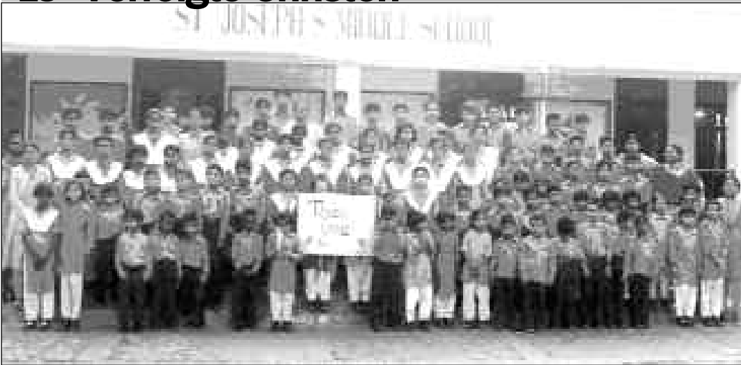
Eine gute Schulbildung: wichtiges Kapital besonders für Christen in muslimischen Ländern

Nach vielen in islamischen Ländern verbrachten Jahren berichtet der Autor über seine Eindrücke und das Verhältnis von Muslimen und Christen – insbesondere über die Bedrängnis der Christen in Pakistan.