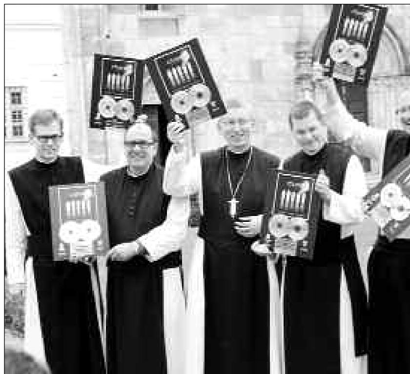
Mit ihrem Gesang auf CD hatten die Mönche in Heiligenkreuz international Erfolge landen in den Pop-Charts

uns fast unbegrenzt zur Verfügung: Die Bibel (46 Bücher im Alten, 27 im Neuen Testament!) ist voll von Geschichten über Gott, der das Heil wirkt. Es gibt das Leben der Heiligen durch 2000 Jahre Kirchengeschichte, voller Action! All das ließe sich verfilmen.