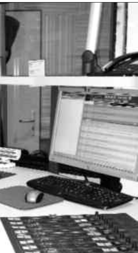
„n getragene Initiative, die mit modernen h tätig

funden, nahm auch sie an einem Cursillo teil. Und damit begann ein neuer Abschnitt in unserem Leben, geprägt von dem Wunsch, unbedingt weiterzugeben, was uns geschenkt worden war.