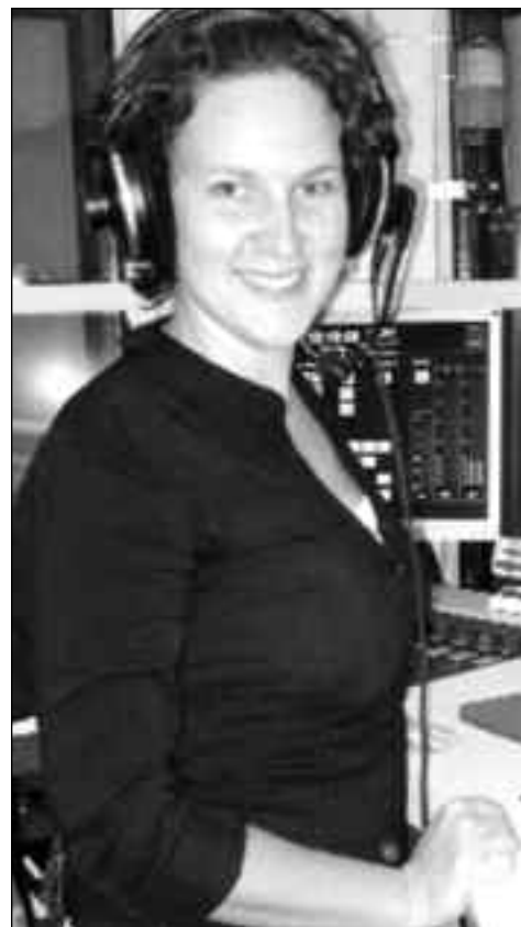
Radio Maria: Eine von Laien und Priestern weltweit erfolgreich missionarisch

Ein Gesprächspartner. Einer, der alles neu machen kann und macht. Ich könnte den Tag, ja beinahe die Stunde nennen, wo mir all das plötzlich klar wurde.