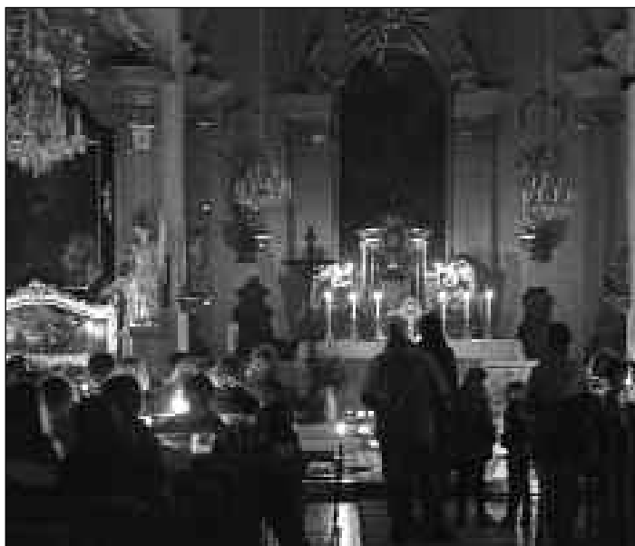
Ein wichtiges Angebot: die Anbetungsnacht

Im Zuge der Erwachsenenfortbildung wird seit 2012 wöchentlich eine Glaubensvertiefung angeboten, im vergangenen Jahr haben wir große Heilige besprochen. Als Lektüre dienten die Generalaudienzen von Papst Benedikt XVI., der von 2006 bis 2011 große Gestalten der Kirchengeschichte vorstellte. Die Auseinandersetzung mit Glau-