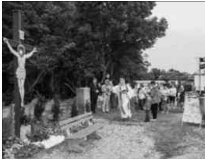
Wallfahrt im Ort: zu Marterln, zum Friedhof, zu Kirchen...

Das Sakrament der Versöhnung, die hl. Beichte, hat im