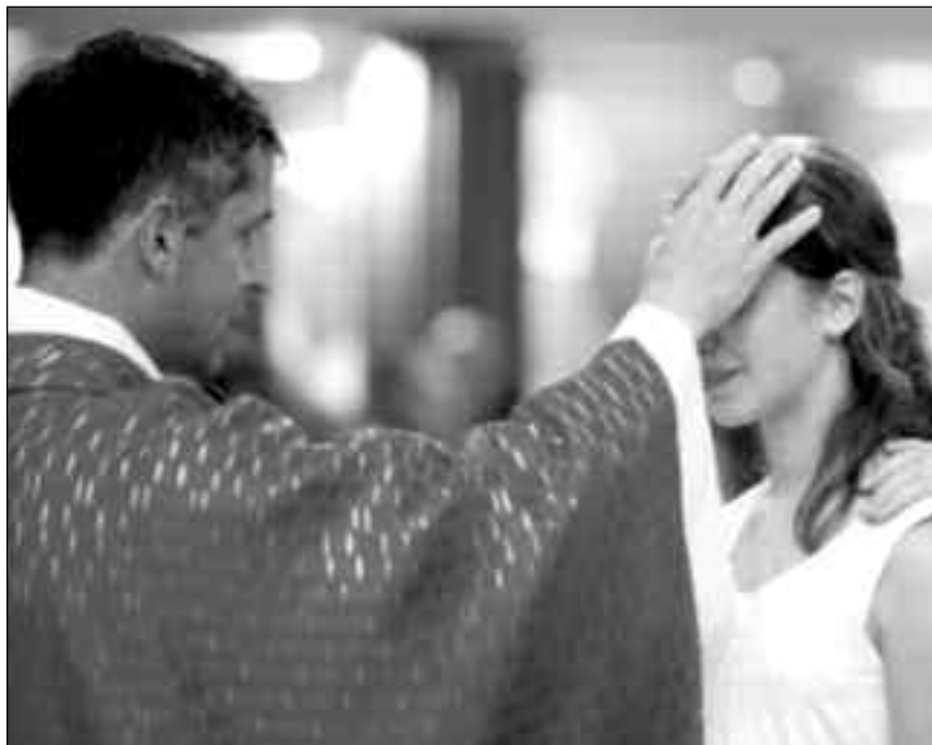
Die Firmung: Soll den Christen zum Zeugnis für Jesus Christus in der Welt befähigen

Punkte bei all diesen Möglichkeiten festmachen.