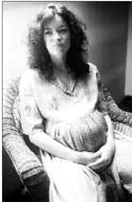
Viele Mütter brauchen Hilfe und Ermutigung, um ihre Kinder gegen den Willen ihrer Umwelt austragen zu können

Wenige Tage später erfahren die Beter folgendes: „Liebe Beter, heute hat sich die verzweifelte Mutter wieder an uns gewendet. Sie weiß nicht mehr weiter. Der Ehemann und die Mutter erwarten von ihr, dass sie kommende Woche zur Abtreibung geht. Sie fragen, wann der Termin ist, damit sich der Mann