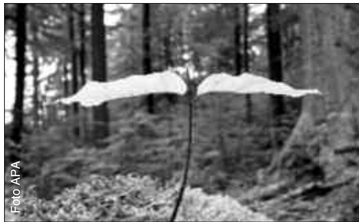
Aufforstung von riesigen Gebieten als Mittel im Kampf gegen die Klima-Erwärmung

In einem Interview aus dem Jahre 1988 sagte der damalige Kardinal (Ratzinger, Anm.), dass wir heute Menschen brauchen, die vom Evangelium getroffen sind. Ich