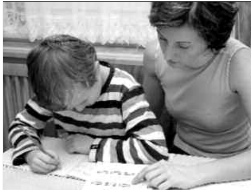
Eltern sind heute gefordert, ihre Kinder rechtzeitig aufzuklären

der, beginnend in den Kindergärten, möglichst früh vertraut gemacht werden.