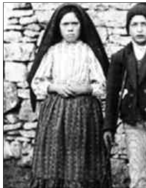
HL. Ludwig: „Während der Endzeit wird Maria von Fatima, Kibeho... Im Bild die Seher-Kinder“