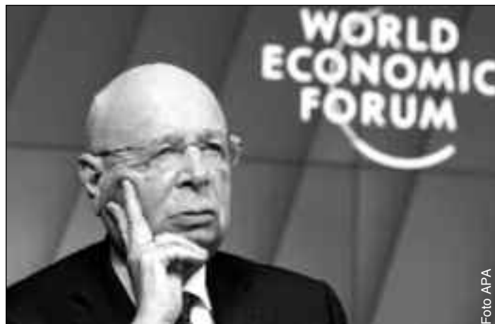
Klaus Schwab, Gründer des Weltwirtschaftsforums, plädiert vehement und erfolgreich für einen gesellschaftlichen Neustart

er nicht mehr weiß, was er tun soll, beschließt, wie ein Kind zu handeln, das ein Puzzle zusammensetzen will, das größer und schwieriger ist, als es dieses zusammensetzen vermag. Weil es das nicht schafft, wirft es alles