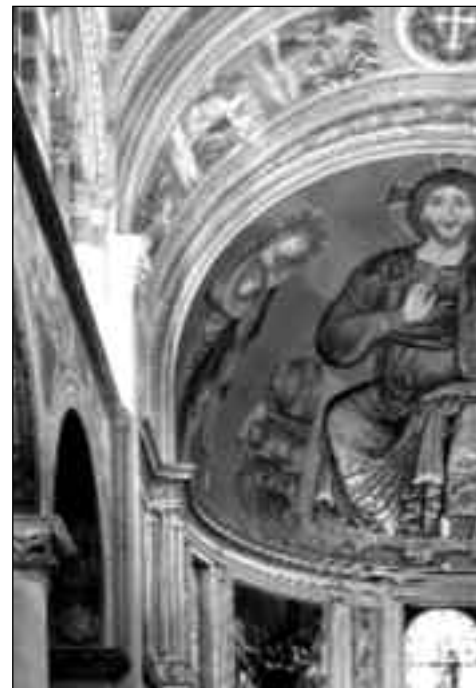
Christus als Pantokrator: Er bleibt trotz aller nisvolle Weise der souveräne Herrscher der Welt.

eine Entwicklung beschleunigt und damit sichtbar gemacht, die sich schon seit langem abgezeichnet hat. Der Umbau unseres gesellschaftlichen Wertesystems folgt einer Logik, die sich aus dem Fortschrittsdenken der letzten Jahrzehnte fast zwangsläufig ergibt. In seinem internationalen Bestseller (verkaufte Auflage 10 Millionen, übersetzt in 50 Sprachen) mit dem bezeichnenden Titel Homo Deus (Der Mensch als Gott) entwirft der israelische Philosoph Yuval Noah Harari „Eine Geschichte von Morgen“, wie es im Untertitel heißt. Einige Kostproben aus dem Buch lassen erkennen, wohin die Entscheidungen der Eliten unserer Tage, der politischen Entscheidungsträger, der Medienmacher, der Wissenschaftler und Techniker, der Manager von Großunternehmen und der internationalen Organisationen die Menschheit im postchristlichen Zeitalter tendieren. So liest man etwa in der Einleitung: „Nachdem wir ein beispielloses Maß an Wohlstand, Gesundheit und