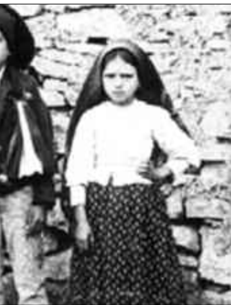
Mariamehr als je hervortreten...“: Lourdes, Tochter von Fatima

Wirklichkeit das Ziel, Leben zu vernichten, die Menschenwürde zu relativieren und Ungeborene sowie Sterbende, die der Gesellschaft zur Last fallen, zu entsorgen.