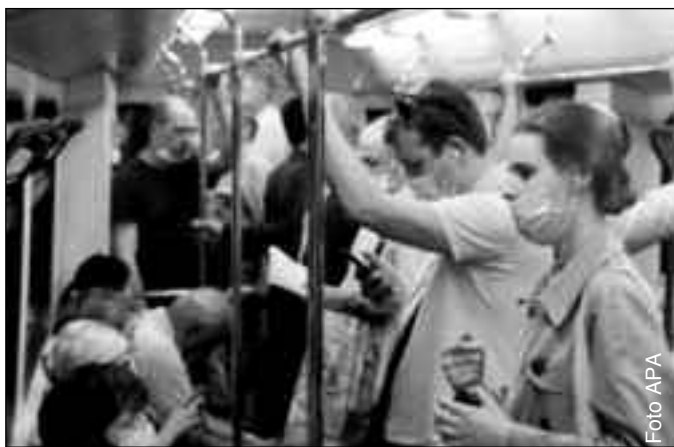
Du bist kein anonymer Maskenträger, sondern ein geliebtes Kind Gottes!

much“ wird, lausche, wie er vom Reich Gottes erzählt, das ist faszinierend, ebenso wie die Unke, die da regungslos und glänzend in der offenen Hand sitzt, die mein Sohn mir entgegen hält.