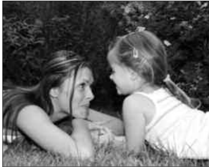
Mit den Kindern gemeinsam Natur erleben

Das heißt freilich noch nicht so ohne Weiteres, dass ihnen die Achtung vor der Natur selbstverständlich ist. Sie bedienen