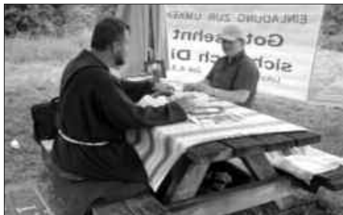
Beicht-Oase auf der Wiener Donau-Insel (auf dem Tisch im Vordergrund: eine Ausgabe von VISION2000)