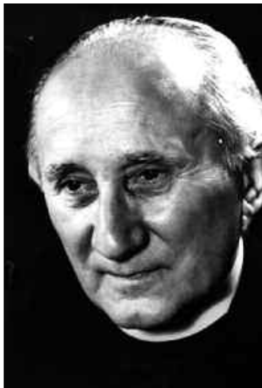
Romano Guardini, einer der großen Theologen

meint, der Mensch könne einfachhin Macht haben und in deren Gebrauch sicher sein – durch irgendwelche Logik der Dinge, die sich im Bereich seiner Freiheit ebenso zuverlässig benehmen müssten, wie in dem der Natur. So ist es aber nicht.