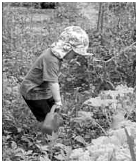
Kindliche Freude am Wahrnehmen des Wachsens

In unserem Zeitgeist heute beginnt die Natur, wieder einen berechtigten Stellenwert zu haben. Aber eine Erziehung dazu muss von einer aufmerksamen Naturliebe begleitet sein, wenn sie bei den Kindern haften soll; denn nur wer liebt, versucht das, was er liebt, wertzuhalten und zu beschützen. Und wie nötig ist das in unser aller Situation!