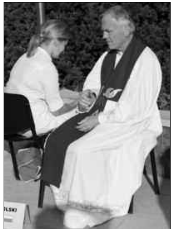
Nach der Beichte sehen Frauen jünger aus...

Das ist unterschiedlich. Es gibt Menschen, die eine hohe Verantwortung haben. Von manchen sagt man, sie hätten täglich gebeichtet, z.B. Päpste. Wenn ich Verantwortung für die Weltkirche, für mehr als eine Milliarde Katholiken habe und Entscheidungen treffen muss, dann bin ich viel mehr gefordert in meinem Gewissen als ein Durchschnittschrist. Und dann gibt es die normale Bevölkerung. Da gehen viele am Herz-Jesu-Freitag, dem ersten Freitag im Monat, beichten – und wenn es da nicht geht, um diese Zeit