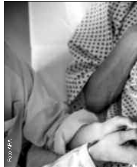
Menschliche Begegnung: Ein positives

SITTE: Was ist unerträglich, was ist erträglich? Was bedeutet das