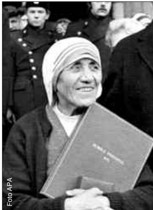
Mutter Teresa: Nobelpreisverleihung 1979

Unsere Rettung wäre das, was die Bibel Umdenken und Umkehr nennt. Dazu sagte Mutter Teresa: „Der größte Zerstörer des Frie-