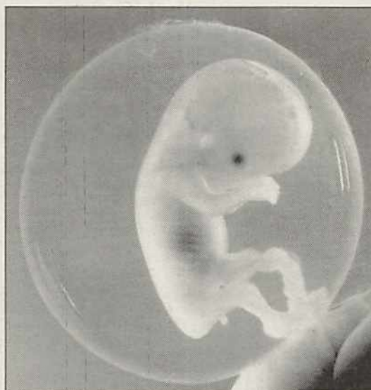
Das Baby im dritten Monat

2. Monat: Innerhalb von vier Wochen wächst es von 5 mm auf 3 cm. Die bereits begonnene Ausbildung der äußeren und inneren Organe wird fortgesetzt. Am Ende dieses Monats werden alle Organe an ihrem endgültigen