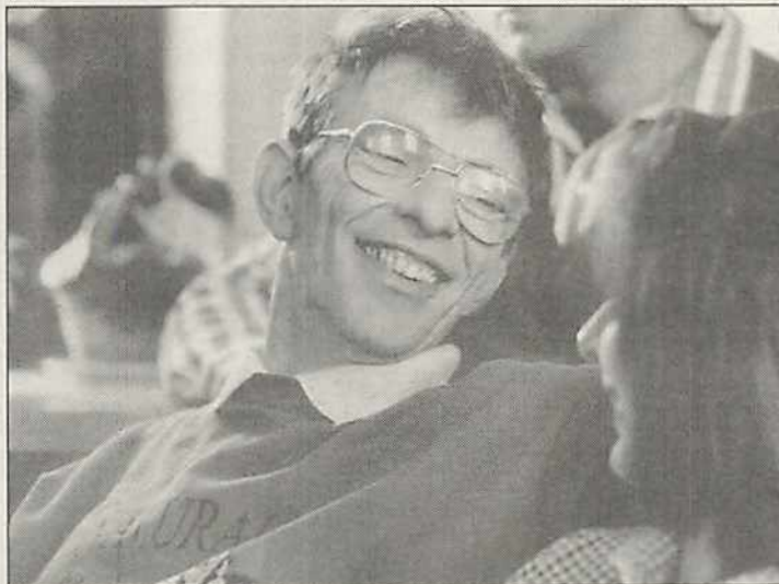
Viel Lebensfreude bei behinderten Menschen, die geliebt werden

Ich habe eine leichte Behinderung: Der Staat hat sie auf 80 Prozent eingeschätzt: Probleme bei aufrechter Haltung. Wegen der Hüftluxationen. Ich sehe nur auf einem Auge: 60 Prozent nach Korrektur.